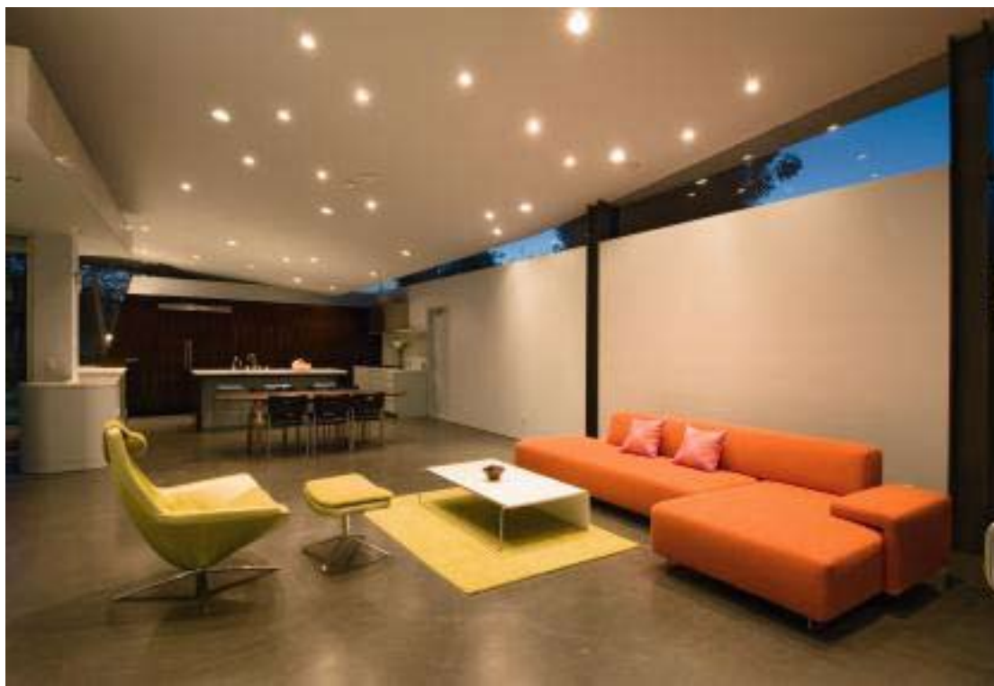
Εικ. 1 Τυπική εφαρμογή με χωνευτά φωτιστικά οροφής

Η τελευταία κατηγορία των χωνευτών σποτ, είναι η πιο διαδεδομένη τα τελευταία χρόνια. Τα σποτ έκαναν τις πρώτες τους εμφανίσεις σε επαγγελματικούς χώρους ενώ στη συνέχεια είδαμε όλο και περισσότερες εφαρμογές και σε οικιακούς χώρους. Σημαντικοί παράγοντες σε αυτή την πραγματικά ταχύτατη εξάπλωσή της χρήσης τους ήταν δύο: α) Οι εξαιρετικές δυνατότητες που έχουν όσον αφορά στο θέμα της στόχευσης και β) Η ραγδαία διάδοση και εφαρμογή της γυψοσανίδας ως κατασκευαστικού υλικού, η οποία έδωσε εύκολες λύσεις για την τοποθέτηση φωτιστικών κάθε είδους.